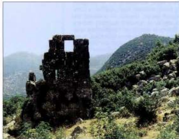
36. β. Αίαια. Εξωτερική και εσωτερική όψη βόρειου πύργου.