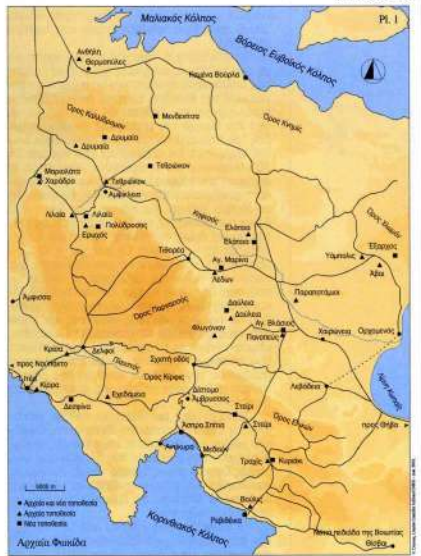
2. Η αρχαία Φωκίδα.

Το 396 π.Χ. ξέσπασε πόλεμος μεταξύ Αμφισσέων και Φωκικών, επειδή οι πρώτοι θέρισαν και πήραν ως λεία το σπάρι από ένα αμφισβητούμενο συνοριακό κομμάτι γης στα δυτικά του Παρνασσού 23 . Η γη αυτή θα πρέπει να ανήκε στην πόλη Χαράδρα (κοντά στα σημερινά Μοριαλάτα) που συνόρευε με την Αμφισσα. Η Χαράδρα ήταν πολύ μικρότερη σε έκταση (το κάστρο της περικλείει μόλις 25 στρέμματα), και κατά συνέπεια και σε πληθυσμό, από την Αμφισσα, την πρωτεύουσα των Λοκρών Οζόλων. Οι κάτοικοι της Χαράδρας δεν επιτέθηκαν μόνοι τους στους Αμφισσείς. Τα συμφέροντά τους τα υπερασπίστηκε ο στρατός της συμπολιτείας –ολόκληρος ο φωκικός στρα-