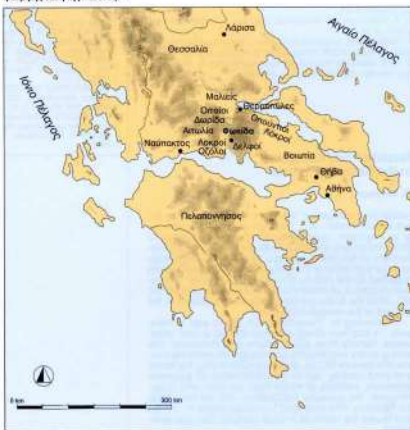
1. Χάρτης όπου σημειώνεται η ακριβής θέση της Φωκίδας.

Στις αρχές του 6ου αιώνα π.Χ., μετά το τέλος του Α΄ Ιερού Πολέμου, οι Φωκείς βρέθηκαν σε πολύ δυσμενή θέση. Έχασαν τον έλεγχο του μαντείου των Δελφών και τη σημαντική τους πόλη Κρίσια, ενώ τα εδάφη της –που περιλάμβαναν το Κρισιαίο πεδίο, τη δεύτερη σε μέγεθος ευνοημένη πεδιάδα τους– αφιερώθηκαν στο θεό Απόλλωνα και δεν μπορούσαν πλέον να τα καλλιεργήσουν 5 (όπως θα δούμε παρακάτω).