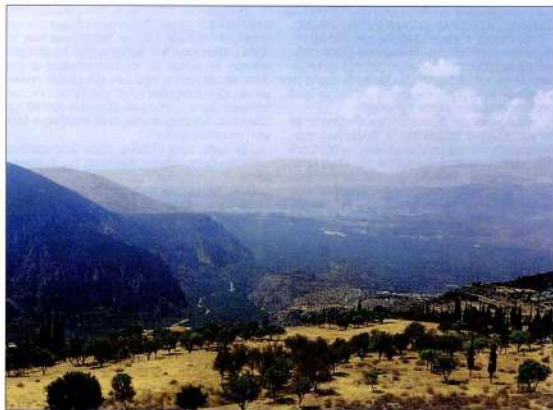
7. Δελφοί. Η θέα προς ίτια και Γαλαξίδι από το κάστρο του Φιλόμηλου.

Οι Φωκείς επανέκτησαν τελικά το μαντείο αναίμακτα, την περίοδο του ανταγωνισμού Αθήνας-Σπάρτης. Το 457 π.Χ., τους το εμπιστεύτηκαν οι Αθηναίοι όταν κατέλαβαν τη Φωκίδα, μετά τη μάχη στα Οινόφυτα 51 . Η αιφομή ίσως ήταν η φιλοπερσική πολιτική του μαντείου και των Θεοσαλμών που το ήλεγχαν, η πραγματική αιτία όμως ήταν ότι οι Αθηναίοι ήθελαν την προμαντεία. Επέλεξαν του Φωκείς, επειδή τους εμπιστευόταν περισσότερο από τα άλλα μέλη της αμφικτιονίας, λόγω της καλής τους στάσης στους Περσικούς πολέμους.