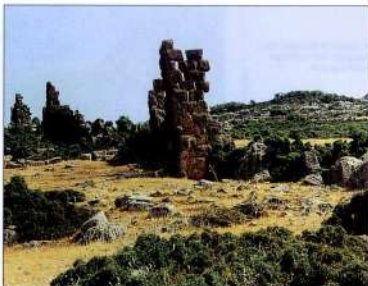
4α. Δρυμναί. Επιπέδω Πύργου 4β. Αποψη των δυτικών πύργων.

στος ή Σεπτέμβριος 338 π.Χ. 30 ). Η χώρα επανέκτησε την εδαφική της ακεραιότητα, ο ετήσιος φόρος που της είχε επιβληθεί από την αμφικτιονία το 346 π.Χ. μειώθηκε από 60 σε 10 αργυρά τάλαντα, συμμετείχε με τρεις αντιπροσώπους στο πανελλήνιο συνέδριο της Κορίνθου 31 και με ένα μικρό εκστρατευτικό σώμα στην εκστρατεία του Αλεξάνδρου στην Ασία 32 .